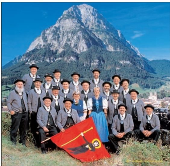
Jodelklub Glärnisch, Glarus