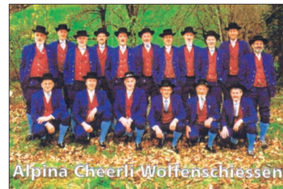
Alpina Cheerli Wolfenschieszen